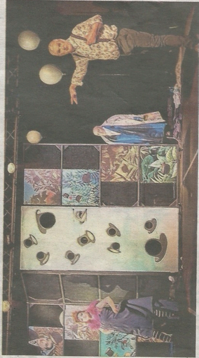
Les acteurs évoluent dans un univers à la Magritte.

"Alcools", au Coin de la Lune à 20h40. Durée : 1h15